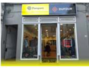
BROCHURE DE MARCA – FRANQUICIA