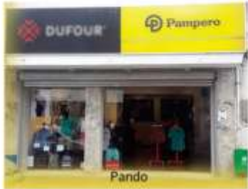
SUCURSAL PANDO Av. Gral Artigas esq. Dr. César Piovone