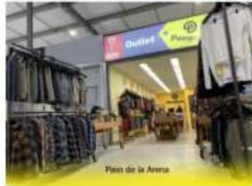
SUCURSAL U.A.M. Outlet- Mercado Polivalente