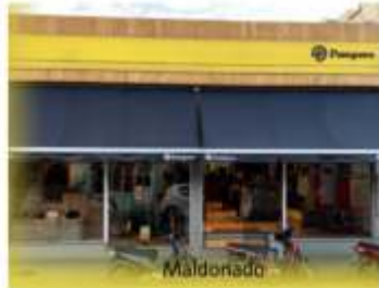
SUCURSAL MALDONADO Centro