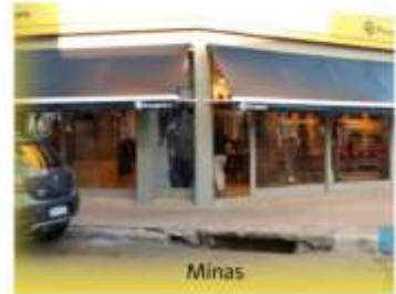
SUCURSAL MINAS Minas