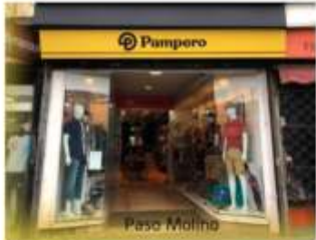
SUCURSAL PASO MOLINO Av. Agraciada 4145, casi M. Sagasta